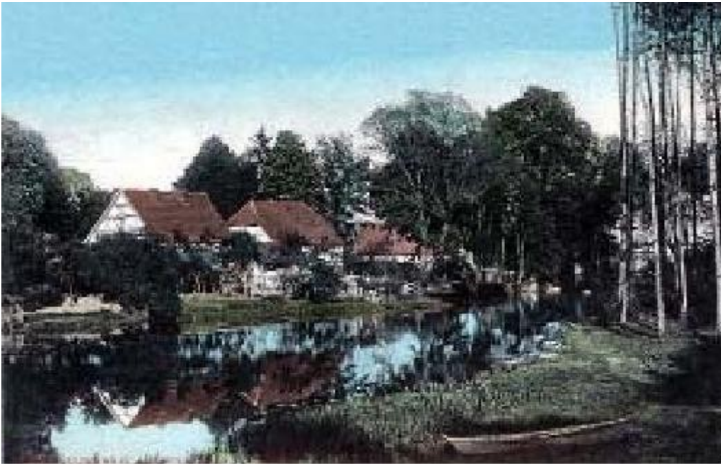
Zanzthal, ehem als Gasthaus Heuer

Es war sicher kein einfaches Leben für unsere Vorfahren dort in der Landsberger Heide. Der karge Boden warf keine reichen Ernten ab, die Waldarbeit war schwer und der Verdienst schlecht. Deshalb war jeder noch so kleine Nebenverdienst sehr willkommen. In den Wäldern gab es reichlich Beeren und Pilze, die fleißig gesammelt wurden. Ein Teil wurde in der eigenen Küche verwertet, der Aöberschuß wurde für gutes Geld nach Landsberg verkauft. Auch die Kinder hatten eine Möglichkeit gefunden, wie man sich etwas Taschengeld verdienen konnte. Zu Pfingsten, wenn die Wochenendausflügler aus Landsberg und Umgebung nach Zanzthal strömten, fingen die Kinder aus dem Dorf an Blumen am Strassenrand zu verkaufen. Die Jungen pflückten in den nahen Waldgebieten Maiglöckchen, welche die Mädchen dann zu 5 Pfennig je kleinen und 10 Pfennig je grossen Strauß verkauften. Am Abend wurde das Geld ehrlich unter ihnen aufgeteilt und ein jedes bestellte sich voller Stolz mit dem selbst verdienten Geld im Gasthaus Heuer eine "Berliner Weiße mit Schuß".