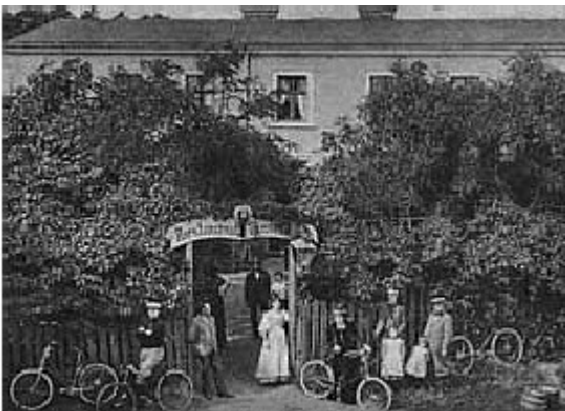
Das Gasthaus „Zum Riesenkrebs“ in Zanzthal

Beide Gasthäuser hatten eine vorzügliche Restauration, dazu Kaffee- und Kuchen-Bewirtung. Von Anfang Mai bis Anfang Oktober jeden Jahres saßen die Ausflügler an schönen warmen Sommertagen im Freien unter alten Bäumen am Teich des Gasthauses "Heuer" und im Kaffeegarten vor dem Gasthaus "Zum Riesenkrebs".